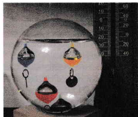
Termoscop Figura 1.6

• Se crede că Santorio Santorio, în jurul anilor 1611 – 1613, a atașat pentru prima dată o scală unui instrument de măsurare a temperaturii.