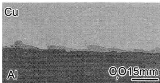
Exemple de difuzie