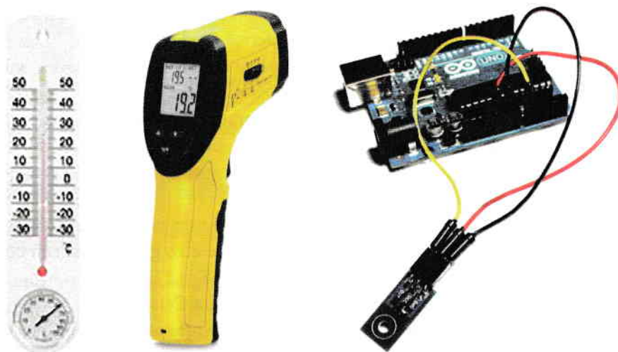
Termometru, pirometru și senzor de temperatură

La adresa: https://astro-pi.org/ găsești un proiect foarte interesant despre măsurarea temperaturii la bordul Stației Spațiale Internaționale cu ajutorul senzorilor de temperatură. Succes!